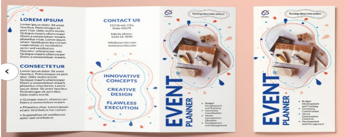
(imagen de ejemplo)