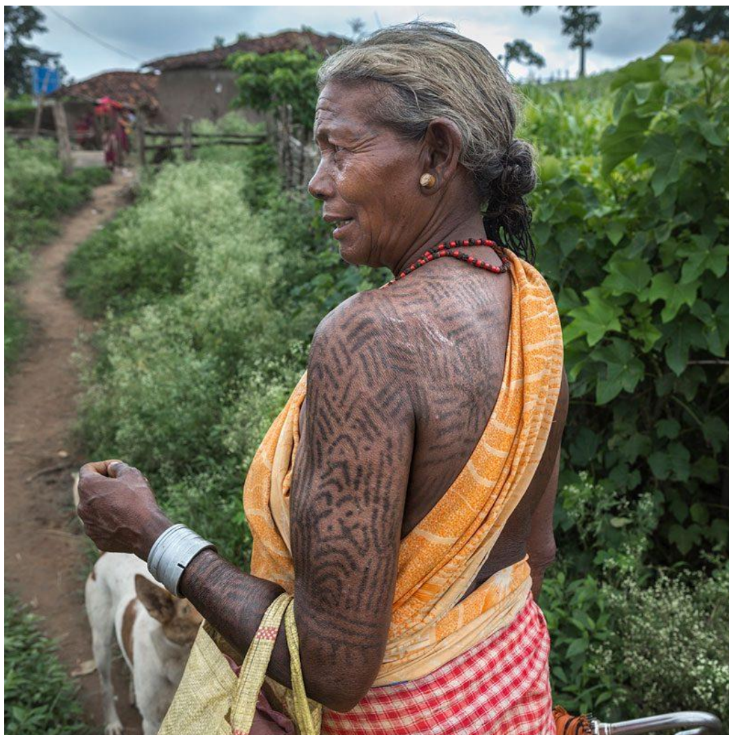
Tatuaje tribal africano

Realizar perforaciones o tatuajes permanentes o semipermanentes como parte de la obra.